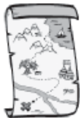
Many people say that a logic model is a roadmap

A logic model เป็นภาพของโปรแกรม ความคิดริเริ่ม หรือการปฏิบัติการที่เป็นภาพง่าย ๆ แสดงให้เห็นถึงการตอบสนองต่อสถานการณ์ที่เกิดขึ้น แสดงให้เห็นความสัมพันธ์เชิงเหตุ เชิงผลระหว่างทรัพยากรที่ลงทุนลงไป กิจกรรมต่างๆ ที่เกิดขึ้น และผลกำไร/ผลงานการเปลี่ยนแปลงต่างๆ นักคิดบางคนเรียกว่า program theory or หรือ ทฤษฎีของโปรแกรม ของการกิจกรรม แนวคิดนี้ "เป็นตัวแบบที่มีเหตุผล (plausible) ใช้วิจารณ์ญาณ (sensible) ที่ใช้คาดการณ์ว่าโปรแกรมจะทำงานได้เป็นจริงด้วยวิธีใด แนวคิดนี้เป็นการวาดภาพภายใต้พื้นฐานของเหตุผลของโปรแกรมหรือความคิดริเริ่ม